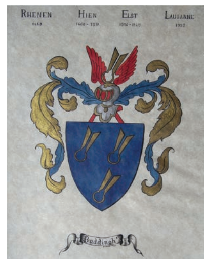
Familiewapen Buddingh', fecit Lausanne 1929 (origineel in heraldische collectie A.J. de Jong)

Primaire bronnen vormen bovengenoemde familiewapens op graven van leden van de familie Buddingh in de Cunerakerk en de kerk van Opheusden; voorts de vele zegels die aangetroffen zijn in het Oud Archief en het Rechterlijk Archief van de stad Rhenen, zoals het zegel van Rutger Buddingh uit 1797, met daarop het schaarwapen. Tot de primaire bronnen kunnen ook de