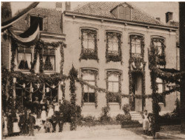
De gevel van het huis Christoffel in 1913 versierd ter gelegenheid van de Onafhankelijkheidsfeesten

Business Sigarenfabriek stichtte. Vele jaren later werd hierin de Knopenfabriek gevestigd, maar ook andere bedrijven zijn hier gevestigd geweest. Op de gevel stond in grote letters EVERWEAR.