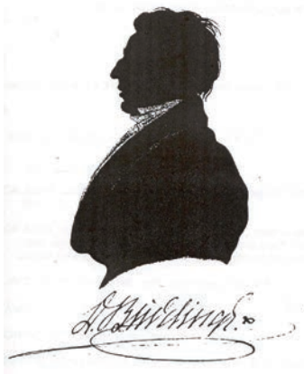
Silhouet en handtekening van de letterkundige D. Buddingh'

worden in de publicaties van Buddingh' beschreven. De volledige wapenbeschrijvingen luiden als volgt: