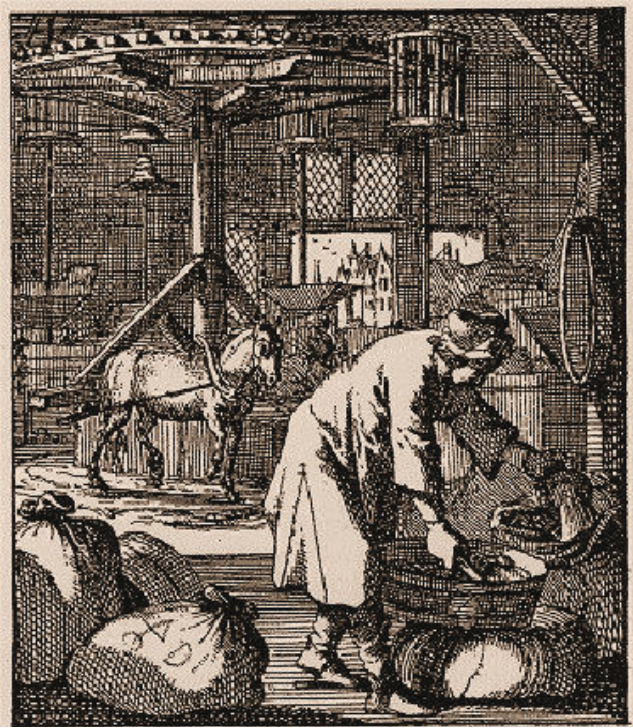
Een grutterij met rosmolen in de 17 e eeuw (uit Jan Luyken 1694)

huis, hofstede en schuur; vermoedelijk bevond zich hierin een grutterij. Inderdaad woonden hier grutters. Vandaar de latere benaming 'Grutterstraat'. De benaming 'grutterij' slaat meestal op een rosmolen waarmee 'gruit' (boekweit) vermalen werd. Het 'recht van de gruit' te Rhenen was ooit in de 13 e eeuw bij de Ridderlijke Duitse Orde komen te liggen, die daarbij ook het patronaatsrecht van de kerk in