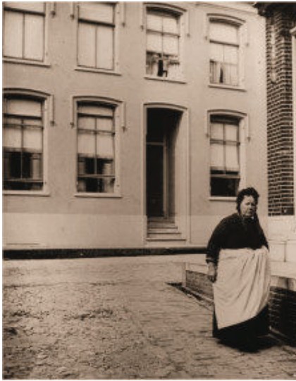
Voorgevel van het huis Christoffel aan de Heerenstraat (nu Fred. Van de Paltschhof) anno 1910

Indië. Veel familieleden van de dames Kraal bekleedden een militaire of bestuursfunctie in Nederlands-Indië en hun kinderen bleven hier in Nederland.