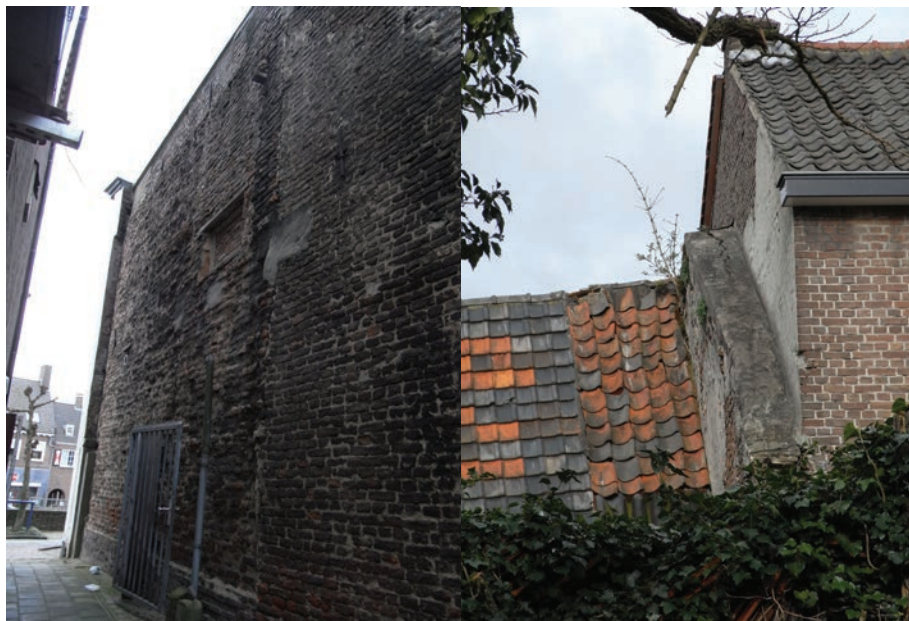
Links: de oude zijmuur van het huidige winkelpand, vroeger St. Christoffel gebeten. Rechts: een gedeelte van een oude dikke muur tegen de zuidkant van het huis Grutterstraat 6 (situatie maart 2014)

Rhenen zie: Archief RDO, Inv.No. 2313 en Oud Archief Rhenen, Toegang 152 (RHC ZOU), Inv.No. 757c (No. 9 charterverzameling)