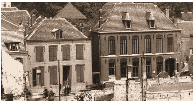
Het huis Christoffel en het postkantoor na de bombardementen in de meidagen van 1940