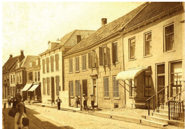
Het huis Christoffel naast de jongedameskostschool net voordat deze afgebroken werd om plaats te maken voor een nieuw postkantoor

Het voorstel is om de gevel te maken van de stenen die uit de stadsmuur komen; dat geeft een besparing van 483 gulden. Ook kunnen de benodigde balken worden gemaakt uit de iepenbomen die op de wal staan en gekapt worden. Het plan is niet doorgegaan omdat de dames Kraal in 1885 het huis