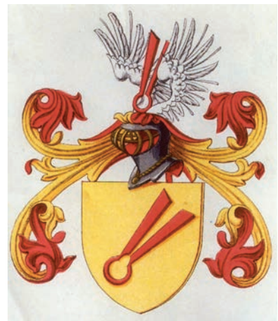
Familiewapen Budding(h) uit het wapenboek van Vorsterman van Oyen

Buddingh' In blauw drie (2 en 1) droogscheerdersscharen van goud, schuinlinks geplaatst met de punten naar boven. Helmteken: tussen een rode vlucht een gouden schaar uit het schild. Dekkleden: goud en blauw. Het wapen Buddingh' (naam met apostrof) wijkt dus af van het meer bekende wapen Budding(h) met in